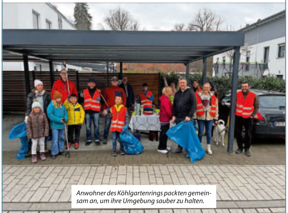
Anwohner des Köhlgartenrings packten gemeinsam an, um ihre Umgebung sauber zu halten.

Die Stadtverwaltung unterstützt derartige Initiativen jederzeit gerne und stellt bei Bedarf auch Zangen und Müllbeutel zur Verfügung.