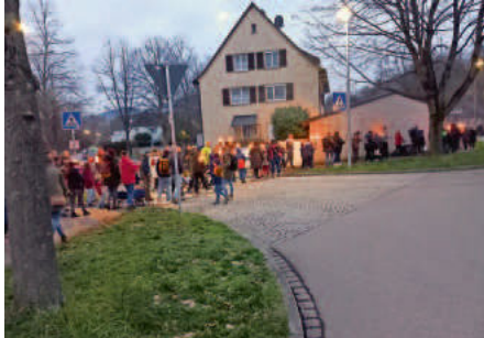
Mit Fackeln aufwärts zum Scheibenfeuer

gekommen, dass nicht alle mehr eine Fackel bekommen konnten. Schön war es dann gemeinsam, auch mit Leuten mit Migrationshintergrund, beim Einbruch der Dunkelheit im Schein der Fackeln den Berg hinauf zum Scheibenfeuer zu laufen. Das ist auch ein Zeichen von gelebter Demokratie.